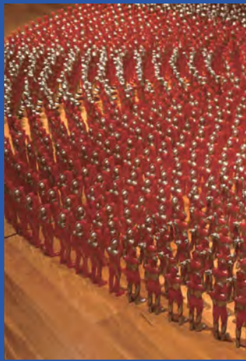
柳幸典「バンザイ・コーナー」 /ベネッセハウス ミュージアム (直島・1991)