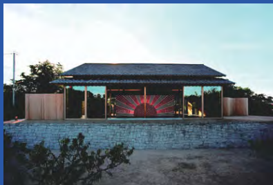
柳幸典「山の神と電飾ヒノマルと両翼の鏡の坪庭」 /犬島「家プロジェクト」《F邸》(犬島・2010)