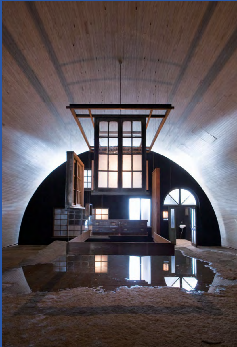
柳幸典「ヒーロー乾電池/ソーラー・ロック」 /犬島アートプロジェクト「精錬所」(犬島・2008)