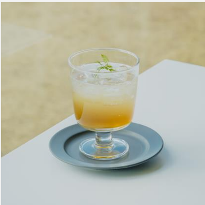
Homemade ginger ale 自家製ジンジャーエール

瀬戸内レモンと季節のハーブを蜂蜜にたっぷり漬けて作る自家製レモネード 蜂蜜を使用しておりますので1歳未満の乳児には与えない様ご注意ください。