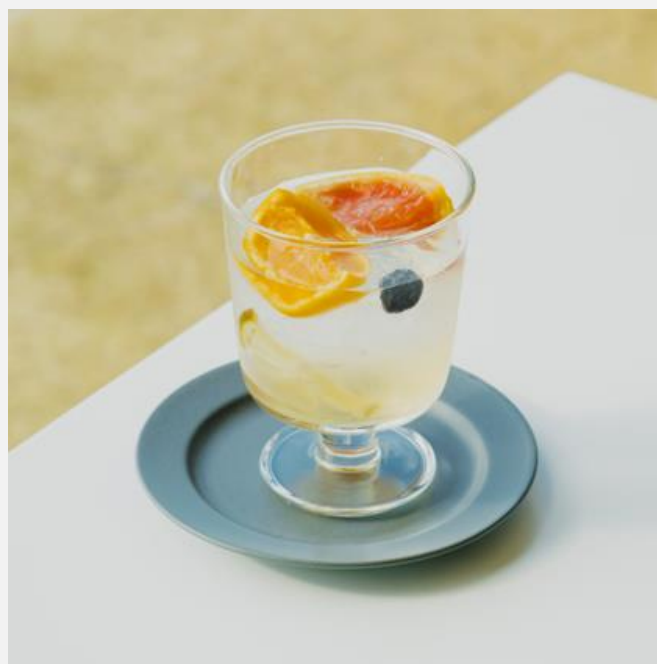
Homemade SETO-PON (Hot/Iced/Soda) 自家製シロップジュース セとぽん