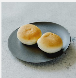
Rice flour bread for gluten-free 米粉パン グルテンフリー対応 ¥ 600