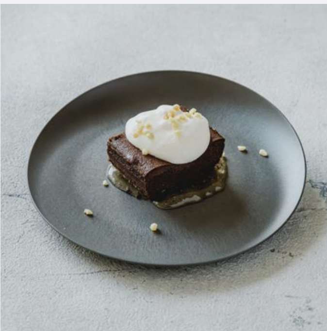
Chocolate cake with rum ラム酒薫るガトーショコラ ¥800

For your safety, please kindly refrain from eating and driving. ラム酒を使用しておりますのでお車でお越しのお客様はご注意ください。