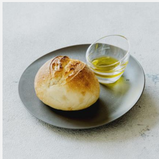
Bread with olive oil パン オリーブオイルを添えて ¥ 600