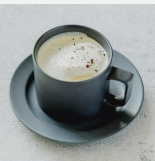
Pumpkin soup 南瓜のスープ ¥ 650