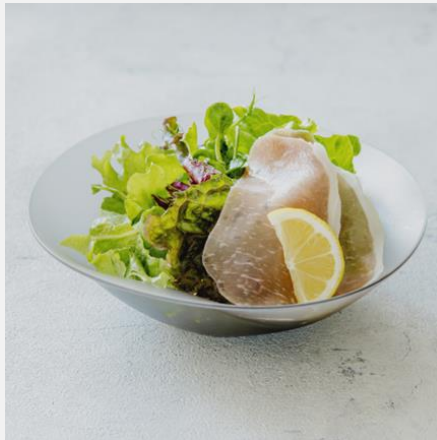
Salad with prosciutto 生ハムサラダ ¥ 800