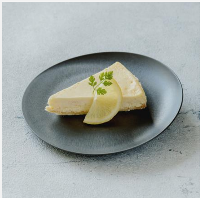
Cheesecake with homemade marinated lemon チーズケーキ 自家製シロップ漬けレモンを添えて ¥800

For your safety, please kindly refrain from eating and driving. ラム酒を使用しておりますのでお車でお越しのお客様はご注意ください。