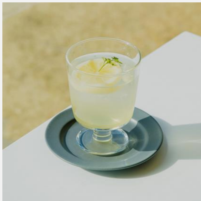
Homemade lemonade (Hot/Iced/Soda) 自家製レモネード