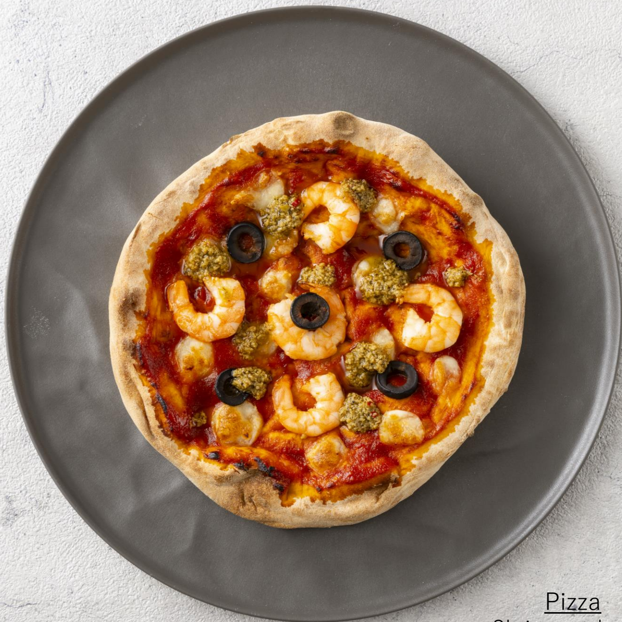
Pizza Shrimp and olive エビとオリーブ ¥1,800