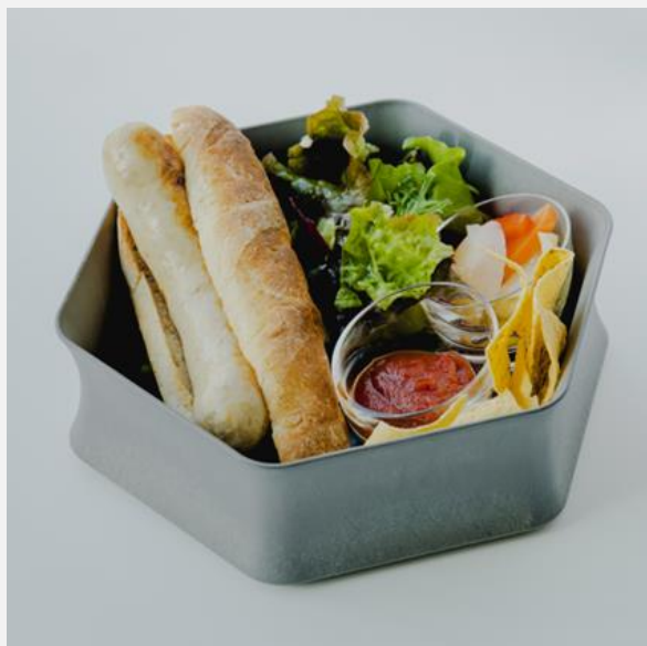
Hot dog box (tomato sauce or olive mayonnaise) ホットドックボックス(トマトソース or オリーブマヨネーズ) ¥1,600