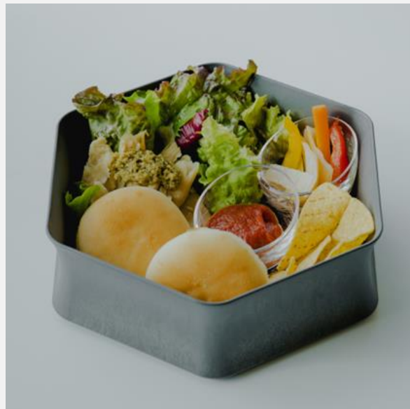
Vegetable box for vegetarians ベジタブルボックス ベジタリアン対応 ¥1,600