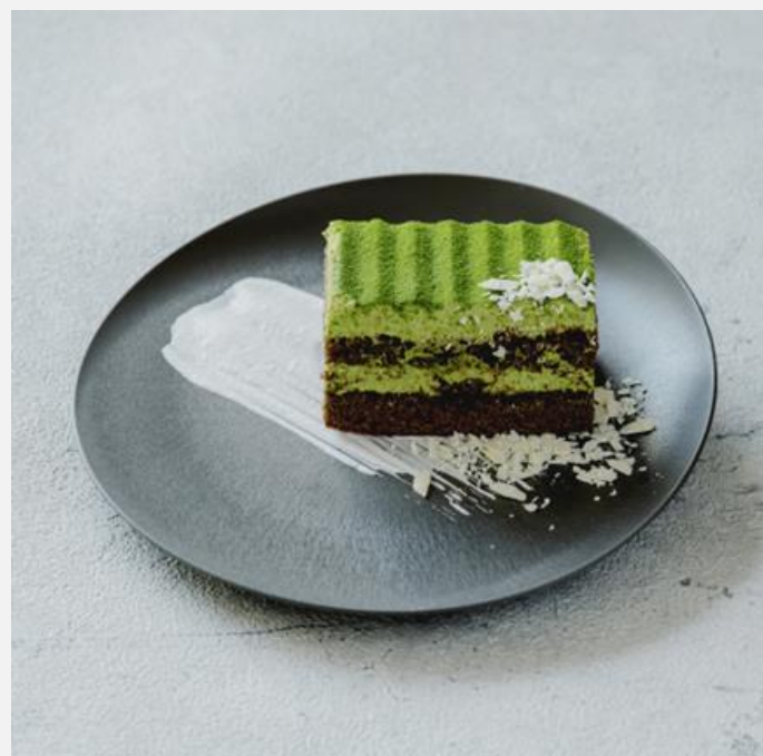
Matcha cake 抹茶ケーキ ¥800

This product contains honey. Please be careful not to give it to infants under 1 year old. 蜂蜜を使用しておりますので1歳未満の乳児には与えない様ご注意ください。