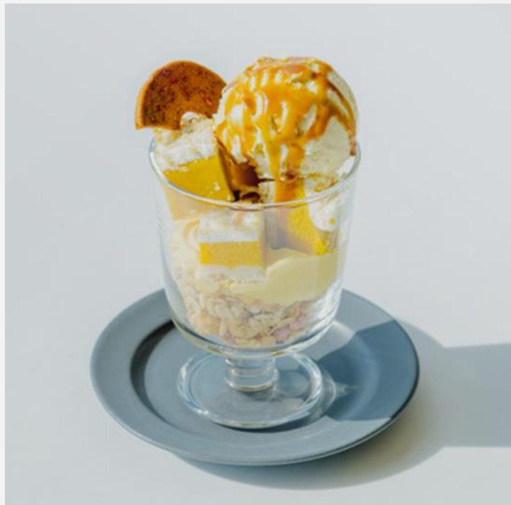
Today's cake and vanilla ice cream with fresh fruits 本日のケーキとバニラアイスクリーム フルーツを添えて ¥1,100

Original dessert inspired by Tatsuo Miyajima's Art House Project 'Kadoya' 'Sea of Time '98' in Honmura area. 本村地区・家プロジェクトで展示のある宮島達男氏の作品をイメージしたオリジナルデザート。 Please ask our staff for a variety of cakes. ケーキの種類はスタッフまでお尋ねください。