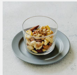
Mixed nuts ミックスナッツ ¥ 550

Please help yourself to water. Tax and service charges are included in the price. If you have any allergies, please let us know. Bringing food and beverages are not permitted. For your safety, please kindly refrain from drinking and driving.