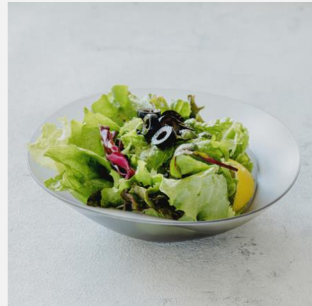
Salad with black olive ブラックオリーブサラダ ¥ 750