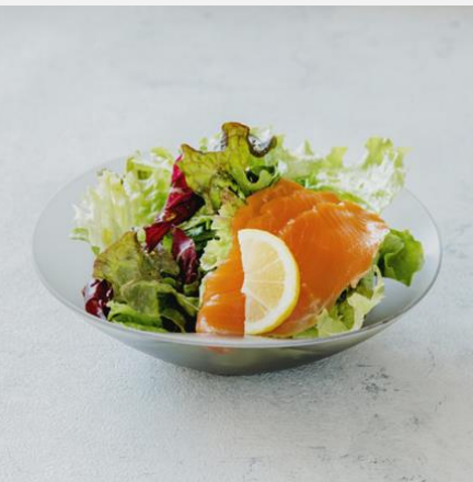
Salad with smoked salmon スモークサーモンサラダ ¥ 800

ベネッセハウスオリジナルオーガニックオリーブオイルと塩・胡椒でシンプルに仕上げました。