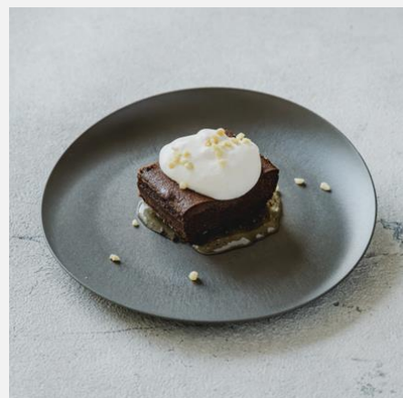
Chocolate cake with rum ラム酒薫るガトーショコラ ¥800

This product contains honey. Please be careful not to give it to infants under 1 year old. 蜂蜜を使用しておりますので1歳未満の乳児には与えない様ご注意ください。