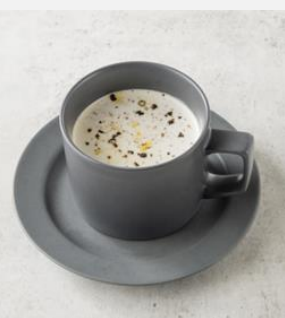
Cold pumpkin soup 南瓜の冷製スープ ¥ 650