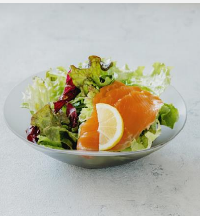
Salad with smoked salmon スモークサーモンサラダ ¥ 800

ベネッセハウスオリジナルオーガニックオリーブオイルと塩・胡椒でシンプルに仕上げました。