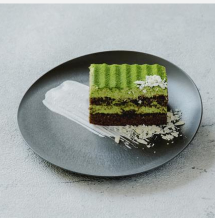
Matcha cake 抹茶ケーキ ¥800