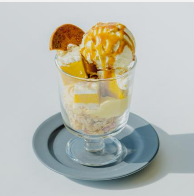
Pumpkin parfait 南瓜のパフェ ¥1,100