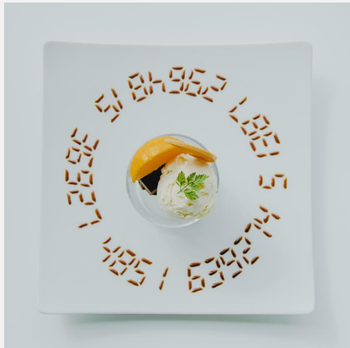
Today's cake and vanilla ice cream with fresh fruits 本日のケーキとバニラアイスクリーム フルーツを添えて ¥1,100