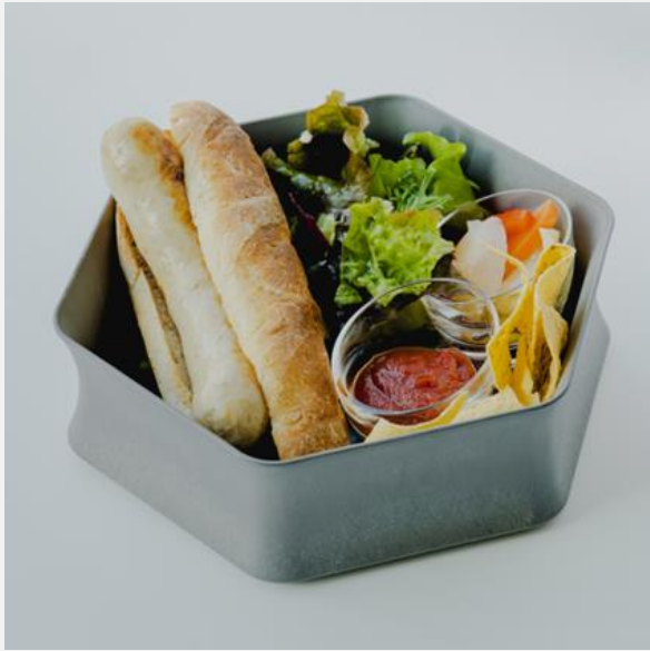
Hot dog box (tomato sauce or olive mayonnaise) ホットドックボックス(トマトソース or オリーブマヨネーズ) ¥1,600