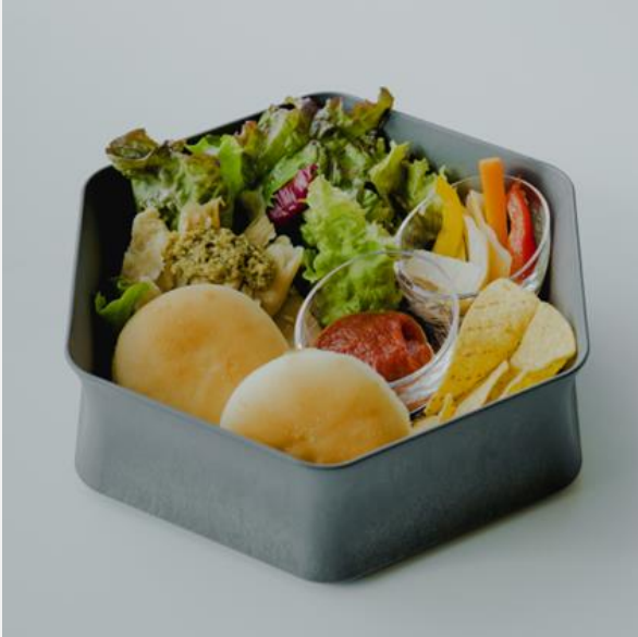
Vegetable box for vegetarians ベジタブルボックスベジタリアン対応 ¥1,600