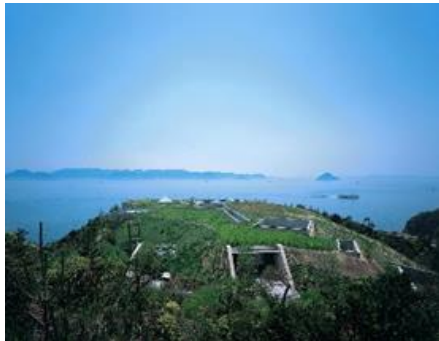
地中美術館

「地中美術館」や「ベネッセハウス ミュージアム」など直島の代表的な美術施設をベネッセアートサイト直島のスタッフがご案内いたします。